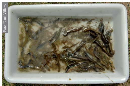
Figura 1. Ejemplares de O. ophryticus capturados en el Pla de Busa el 14 de mayo de 2011.

Las evidencias de reproducción indican que la especie se encuentra bien aclimatada a las condiciones del Pla de Busa. Además, los ejemplares capturados mostraron en ambos sexos tamaños inferiores a los registrados por Arntzen & Olgun (2001), con longitud del cuerpo (SVL) promedio 8 mm inferior, y máxima más