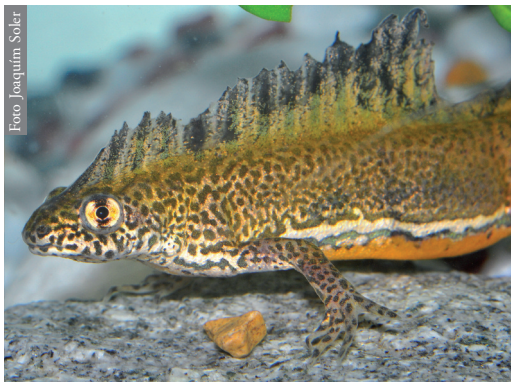
Figura 2. Aspecto de un ejemplar macho de O. ophryticus .

La introducción de especies fuera de su área de distribución natural representa, tras la pérdida de hábitat, la segunda causa de amenaza de la biodiversidad global, con impactos negativos sobre las especies nativas por competencia, depredación, hibridación y contaminación genética, e introducción de agentes patógenos (Pleguezuelos, 2002). Los anfibios son especialmente sensibles a este último fenómeno, exis-