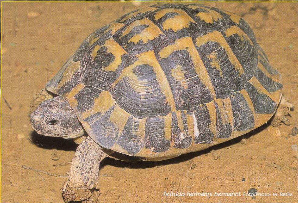
Testudo hermanni hermanni .