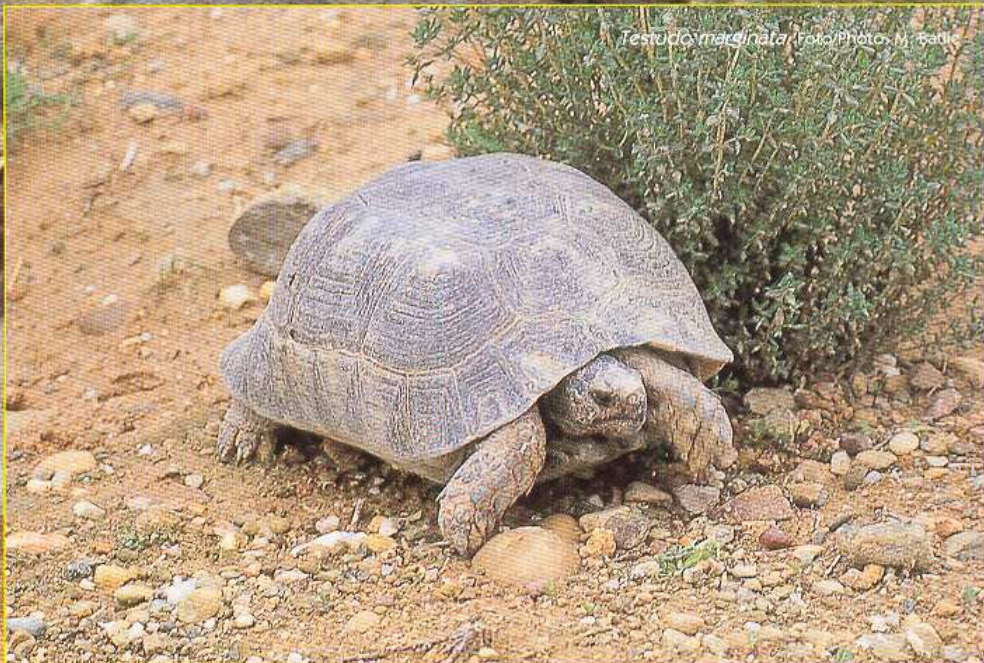
Testudo marginata .

Aunque este patrón de conducta se repite casi siempre, existen diferencias entre las especies, y entre todas las aquí mencionadas podemos considerar el macho de Testudo graeca el más agresivo, incesante y tenaz en cuanto a la búsqueda de