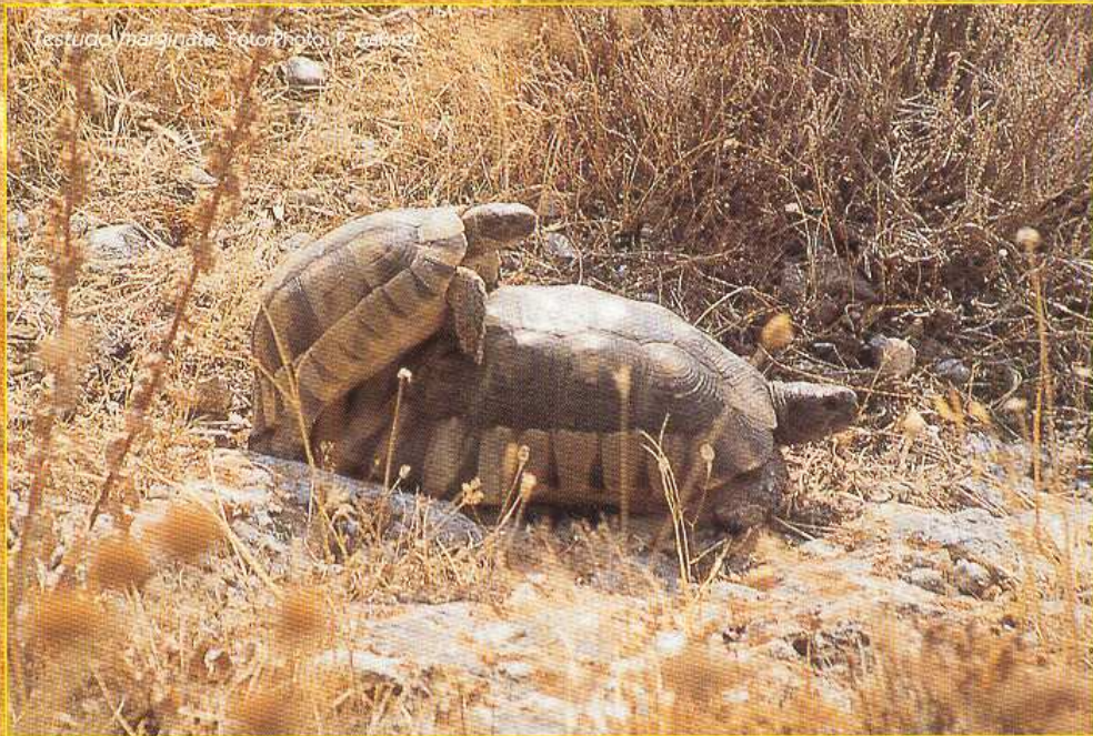
Testudo marginata .