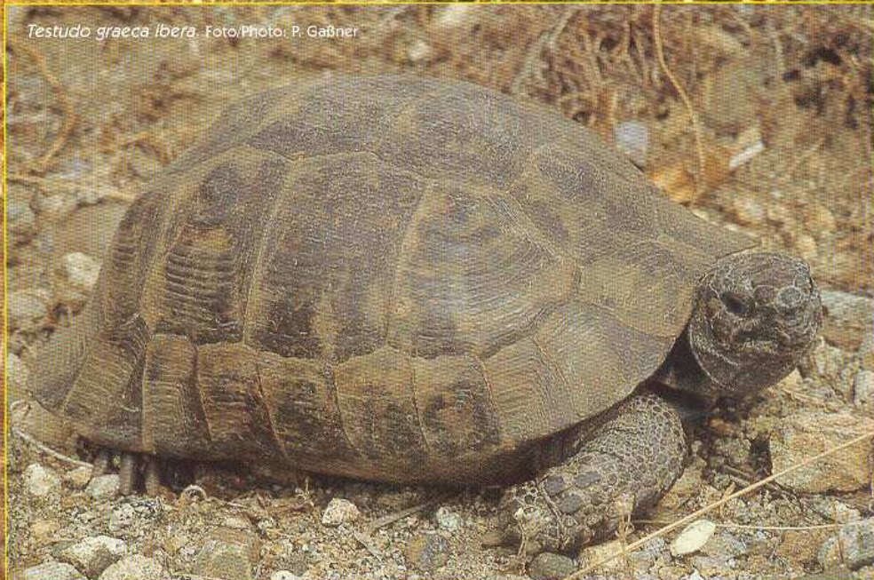
Testudo graeca iberica .