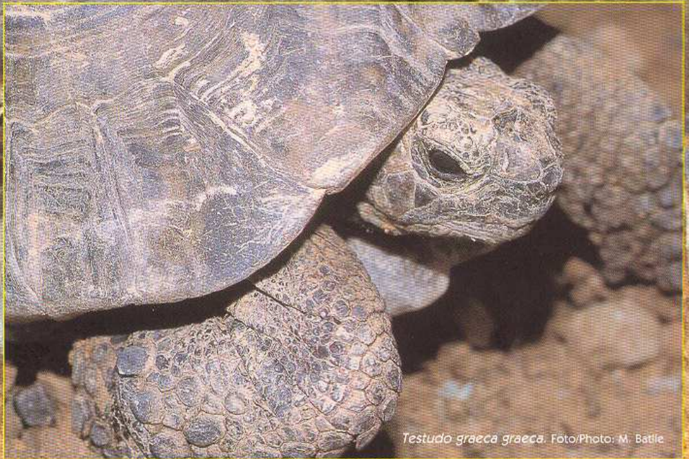
Testudo graeca graeca .

De alimentación claramente herbívora, compuesta de flores, frutos y papilionáceas, entre otras, no desdeña pequeñas y ocasionales fuentes de proteína animal, como lombrices, caracoles e incluso carroña.