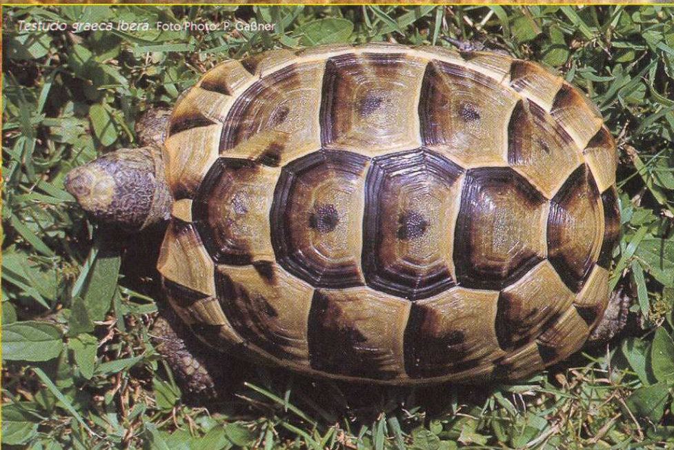
Testudo graeca iberica .